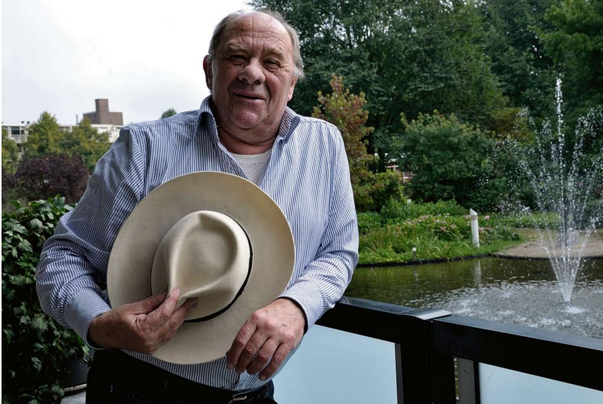
'Ik ben nu eenmaal een jongen met een links imago, maar je weet wel wat je aan me hebt: kwaliteit, straight zo eerlijk mogelijk.'